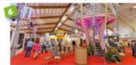
Grande Halle 5 200 m 2 - jusqu'à 5 000 PAX