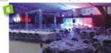
Chat Botté 720 m 2 - jusqu'à 1 000 PAX