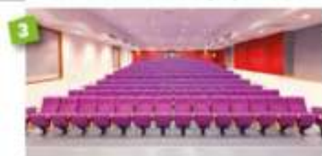
Salle de conférence 200 m 2 - jusqu'à 200 PAX