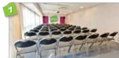
Salles de commission 40 à 60 m 2 - jusqu'à 70 PAX