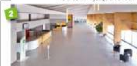
Hall d'Accueil 550m 2 - jusqu'à 500 PAX