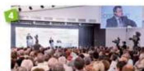
Tambour Major 840 m 2 - jusqu'à 1 000 PAX